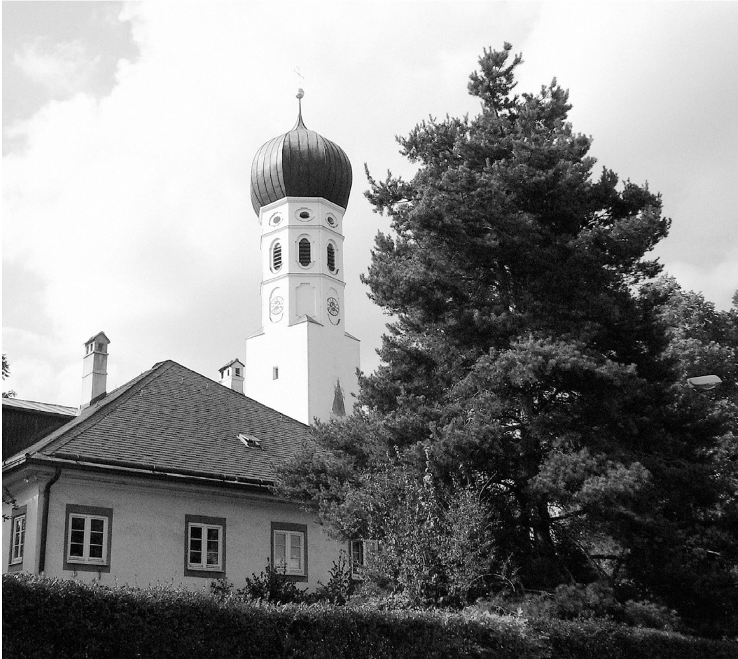
Church of St. Johann Baptist